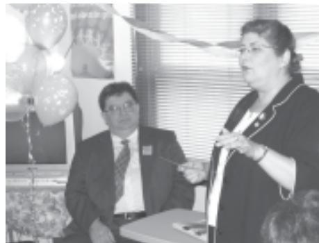
On retrouve le président de la COFAQ et la trésorière lors du lancement des Actes des États généraux sur la famille .